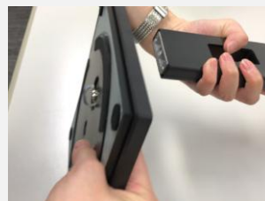
③スタンドを完成させ