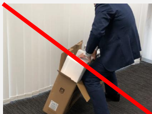
かつての発泡スチロール梱包は取り出しづらい・・・

※仮に 50台 設置する場合、通常約 6時間 かかるところ、省資源化パッケージなら所要時間は約 3時間 です。(所要時間50%削減、自社調べ)