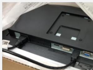
②ケーブル類を繋ぎます。