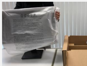
⑤配置したい場所に立て、不織布を取ったら・・・