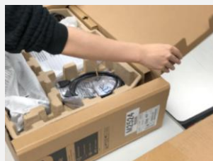
①ピザ箱を開けるように、OPEN上のトレイを取り出します。