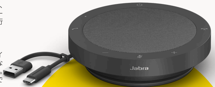
MS TEAMS &amp; UC 対応モデル

地球に配慮するため、Jabra は、製品開発のあらゆる段階でサステナビリティについてもじっくり検討しています。Speak2 40 のケースの 50% 以上にサステナブルな素材** を使用しており、内蔵部品の多くも修理や交換が可能です。 高いサステナビリティ=長いスピーカー寿命=あなたやチームにとって、より高品質で生産性の高い通話を実現します。