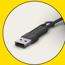
USB-C と USB-A コネクタ同梱