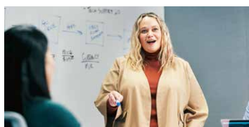
Individualモード ：動的にプレゼンターを追いかけてフレームに収めます。授業やプレゼンなどに最適です。