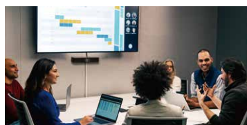
Groupモード ：自動で常に室内の参加者全員を視野角に収めます。グループでの会議に最適です。